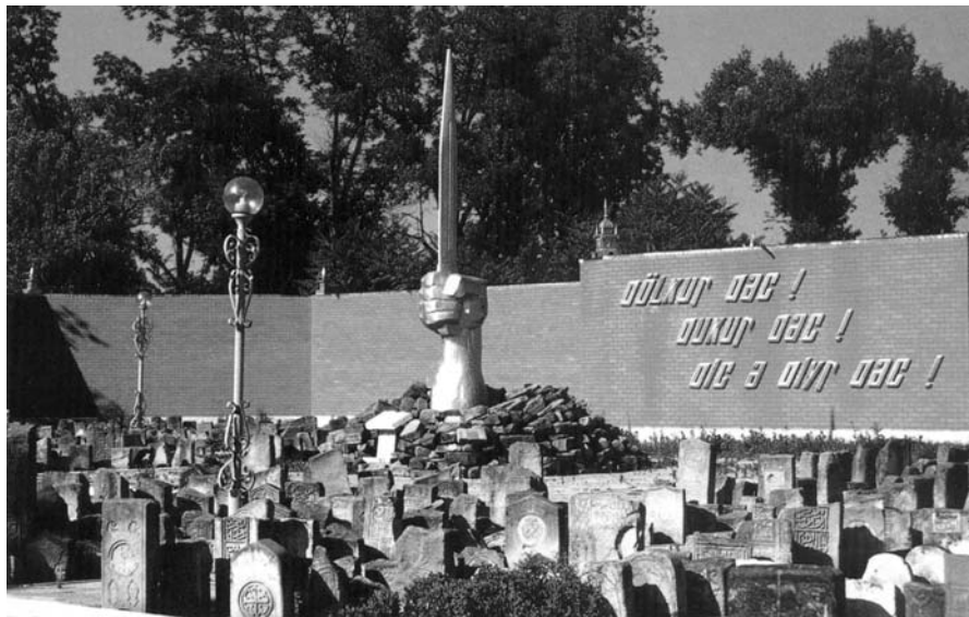
Мемориал жертвам депортации чеченцев и ингушей в 1944 г.

Из приводимых в книге «Хайбах» материалов видно, как это делалось. Целые воинские части не имели отметки о присутствии в феврале-марте 1944 года в Галанчожском районе, указания на это отсутствовали и в военных билетах солдат и офицеров. Труднодоступными оказались сведения о личном составе этих частей, а уже об уничтожении ими нетранс-