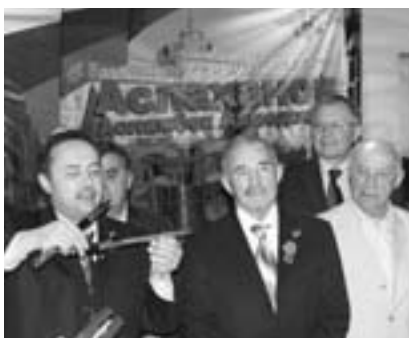
Что еще, как не оружие, можно подарить настоящему мужчине?