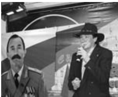
Поет друг и певец Бисер Киров