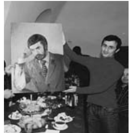
Во время чествования артиста в Московском Доме национальностей