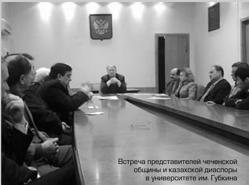
Встреча представителей чеченской общины и казахской диаспоры в университете им. Губкина